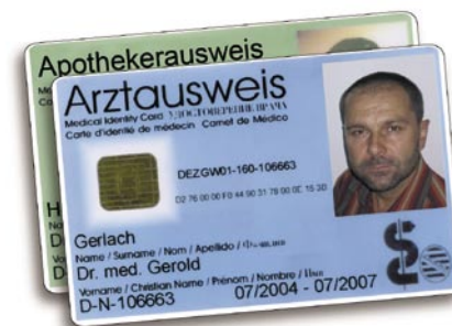
Bis Januar 2005 wurden im Freistaat Sachsen 50 Heilberufsausweise an Ärzte im niedergelassenen und stationären Bereich ausgegeben.

Die Zugriffsberechtigungen auf die Versichertendaten sind für Ärzte, Apotheker und die Heil-/Hilfsmittelerbringer unterschiedlich.